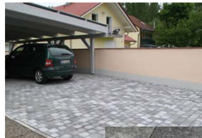
naturgrau + anthrazit nuanciert