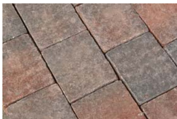
rechts: rot + anthrazit nuanciert