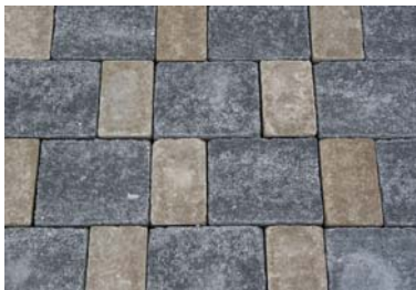
sand + anthrazit (uni)