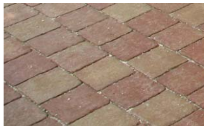
braun + sand nuanciert